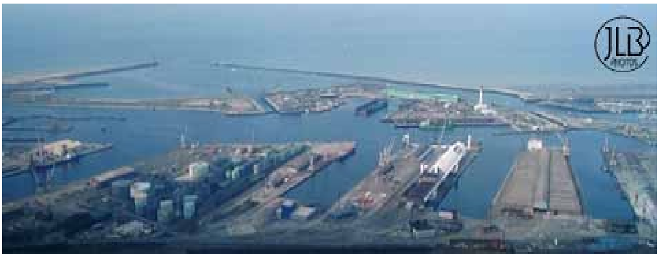
DUNKERQUE PORT INDUSTRIEL