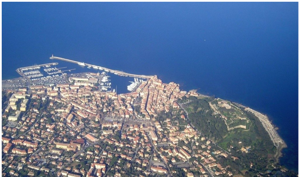
Saint Tropez vu du ciel

La France possède 60 ports de commerce, 40 ports de pêche et une centaine de ports de plaisance.