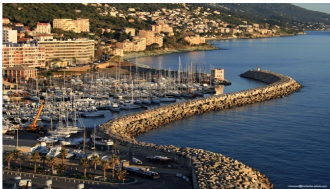
port de plaisance de Toga